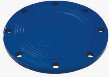
KÖR FLANŞ ( X PARÇASI) BLUNT FLANGED (X PIECES)