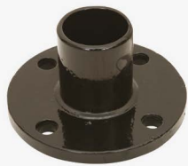
PVC BORULAR İÇİN ( FOR PVC PIPES) GF - GEÇME MUFLU F PARÇASI GF - FLANGED DOVETAILED F