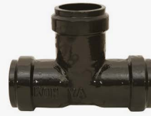
PVC BORULAR İÇİN ( FOR PVC PIPES) G-mmB - GEÇME MUFLU T G-mmB - FLANGED DOVETAILED