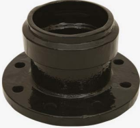
PVC BORULAR İÇİN ( FOR PVC PIPES) GE - GEÇME MUFLU E PARÇASI GE - FLANGED DOVETAILED F