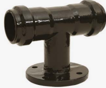
PVC BORULAR İÇİN ( FOR PVC PIPES) G-mmA - GEÇME MUFLU T G-mmA - FLANGED DOVETAILED