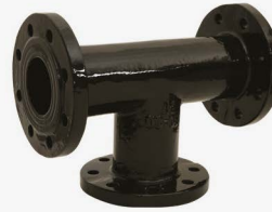
ÜÇ UCU FLANŞLI TE (PT PARÇASI) T PIECES WITH THREE FLANGED (PTPIECES)