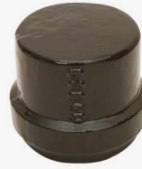
PVC BORULAR İÇİN ( FOR PVC PIPES) GQ - GEÇME MUFLU KÖRTAPALAR GQ - DOVETAILED BUNG