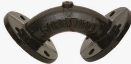
İKİ UCU FLANŞLI DİRSEK (MMQ PARÇASI) TIP TWO FLANGED ELBOW