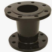
(FFR PARÇASI) İKİ UCU FLANŞLI REDÜKSİYONLAR FFR - REDUCTIONS WITH TWO FLANGED TIPS